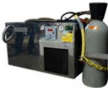
De postmix unit