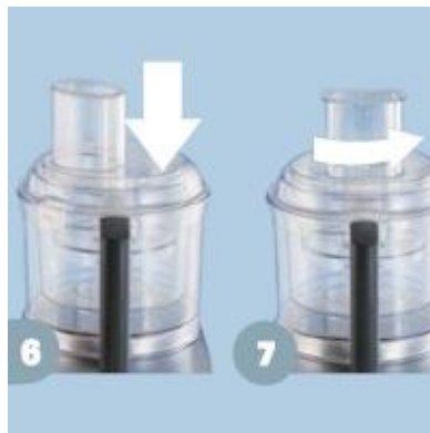
stap 6 en 7